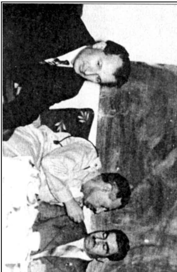
سه‌رۆک بارزانی نهمر - نه‌فسهر - قه‌دری جان (عیراق) ۱۹۵۸ نهم وینه‌یه له په‌رتووکه‌که‌یه دلاوه‌رئ زه‌نگی (نقیسکاری کورد قه‌دری جان) وه‌رگیراوه.